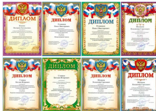
Победители конкурсов Молодежного союза экономистов и финансистов РФ