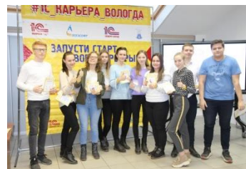
Традиционный «День 1СКарьеры» компании «Логасофт»