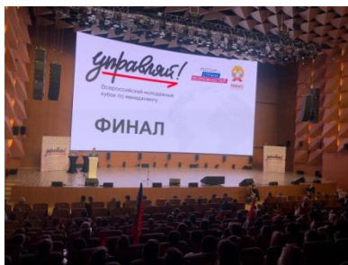
Победители Всероссийского молодежного Кубка по менеджменту «Управляй!»