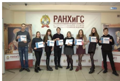
Призеры Всероссийского диктанта по английскому языку