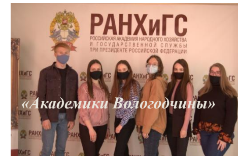
Всероссийский чемпионат по финансовой грамотности