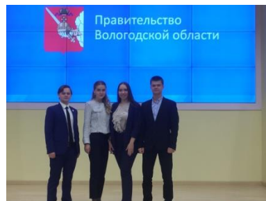
Победители ежегодного областного конкурса научных проектов «Моя стратегия – моё будущее»