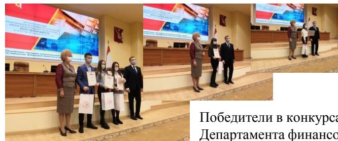
Победители в конкурсах Департамента финансов